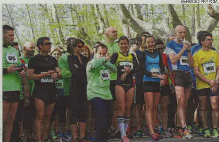
►► Salida de la carrera el año pasado en el parque José Antonio Labordeta.