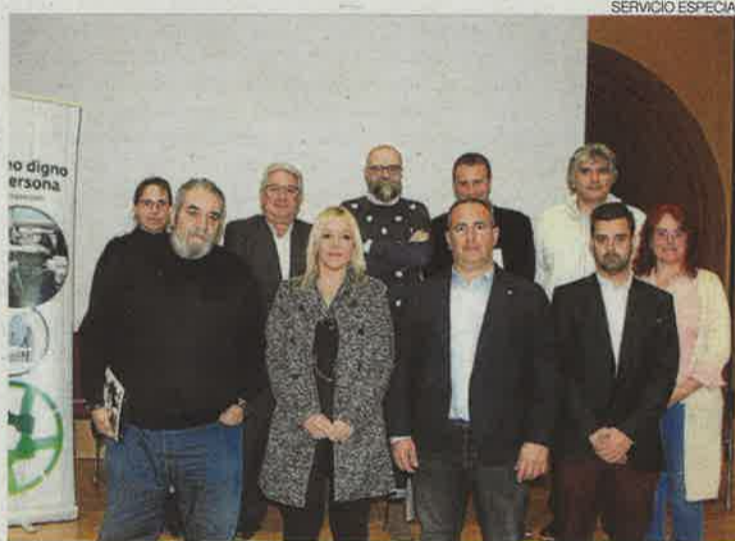
►► El grupo que se reunió en Sariñena la semana pasada.